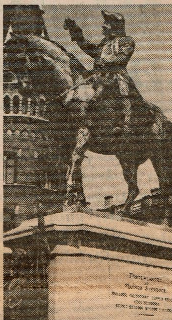
Den övervägande delen av Stenbocksstatyn — den stora massiva sockeln — består av bohusgranit från C.A. Kullgrens Enka