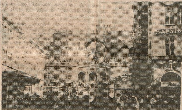
Terrasstrapporna med de vackert mönstrade murarna är också av äkta Kullgrensgranit

Under de senaste åren av sitt liv ägnade hon sig åt släktforskning. Det blev inte bara en hobby – med tiden blev hon t.o.m. sin tids främsta genealog i vårt land. I trots av avtagande synförmåga och fastän hon till slut blev fullständigt blind 1860, samlade hon med otrolig energi genealogiskt och biografiskt material till upprättande av "stamtavlor" över ett flertal släkter. Bl.a. upprättade hon landets största